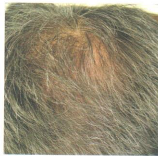
Ergebnis nach 10 Behandlungen 1 : links vorher, rechts nachher